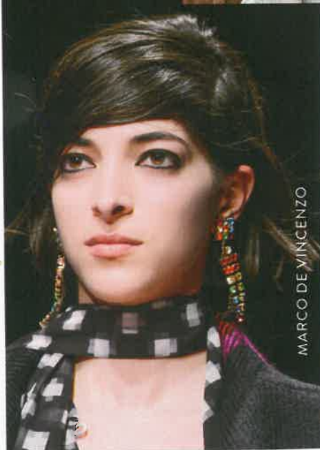
MARCO DE VINCENZO